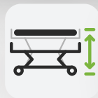
Höhe 375 – 800 mm