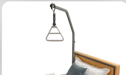
Aufrichter mit Triangel-Handgriff