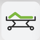
Fußteil 0 – 30°