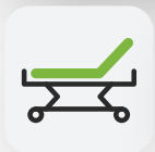
Rückenteil 0 – 70°

Das Ecofit Xtra ist ein durchdachtes Schwerlastbett für die häusliche Pflege. Es ist speziell für adipöse Menschen bis 350 kg Patientengewicht ausgelegt und zeichnet sich durch seine besonders hohe Stabilität aus.