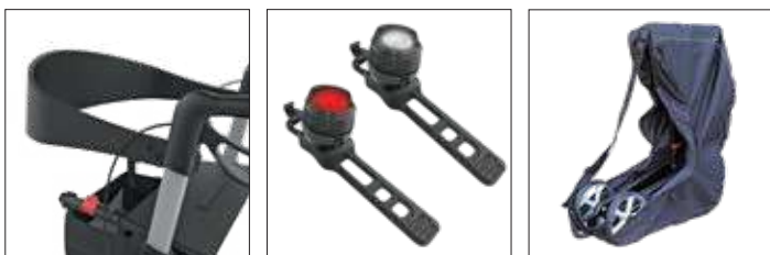
Rückengurt LED-Lampen Transporttasche