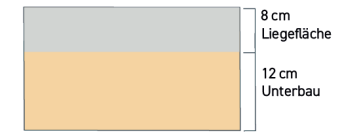
Querschnitt der Standard Schwerlast-Matratze 20 cm