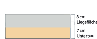
Querschnitt der Standard Schwerlast-Matratze 15 cm